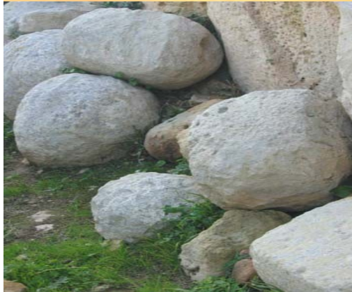
Dawn il-boċċi kbar tal-ġebel instabu Ħaġar Qim. X'aktarx li ntużaw biex fuqhom jitmexxa u jinġarr ġebel megalitiku, li kien ġebel kbir u tqil hafna.